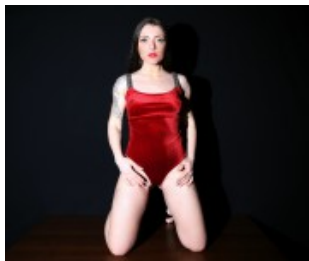
Foto di Intimo - lingerie